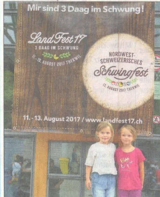
Mit Christian Stucki kommt einer der ganz «Bösen» ans Fraumatt-Schwingen. Abends lädt Therwil zum «Anschwingen» im Hinblick aufs LandFest17 ein.